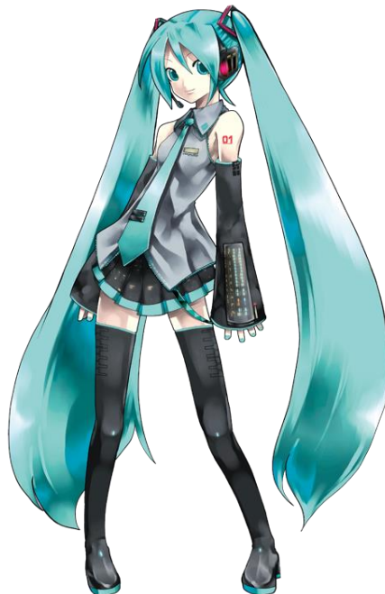
Miku Hatsune (V3)

Il en existe une multitude puisque le logiciel se base sur une base vocale humaine. Leurs chansons sont souvent accompagnées de clips vidéos, où ils sont modélisés (image de synthèse) avec un logiciel appelé MMD (Miku Miku Dance, en référence à Hatsune Miku)